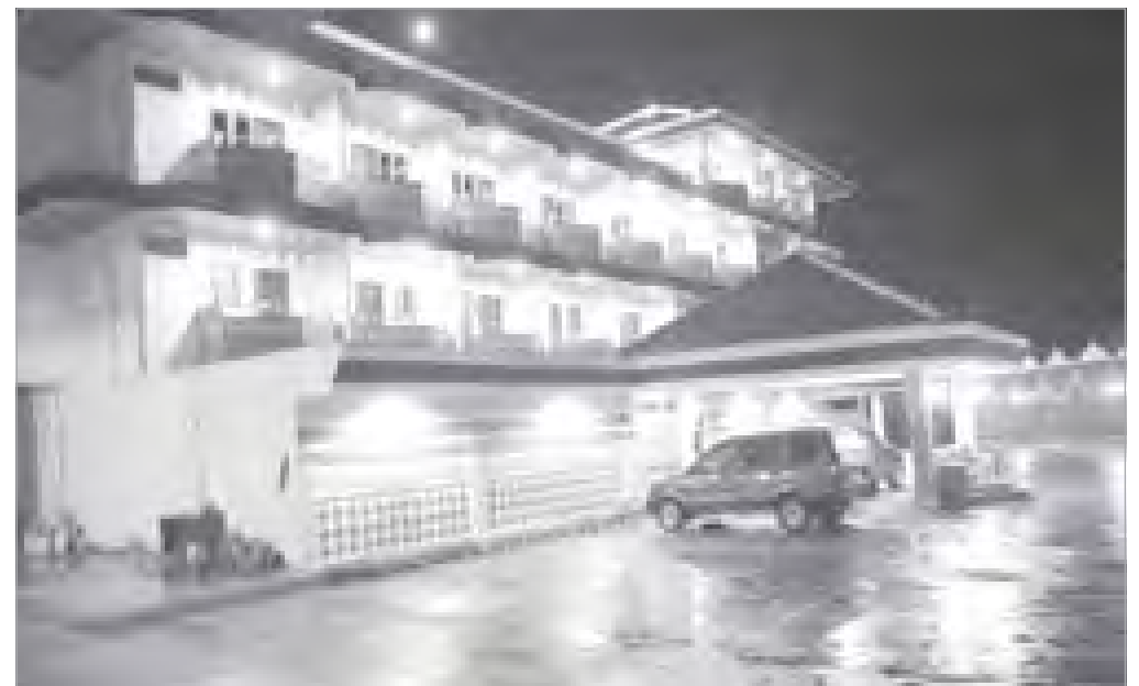
Salah satu hotel di Kota Gisting yang cukup representatif.

Mereka yang terkena rasionalisasi ini dikeluarkan dari TNI, dan disatukan dalam pasukan Corps Tjadangan Nasional (CTN). Mereka direkrut, dibekali keterampilan, peralatan, tanah garapan, pembinaan dan masih digaji selama dua tahun, untuk menjadi petani-petani yang handal di luar Pulau Jawa. Di antara mere-