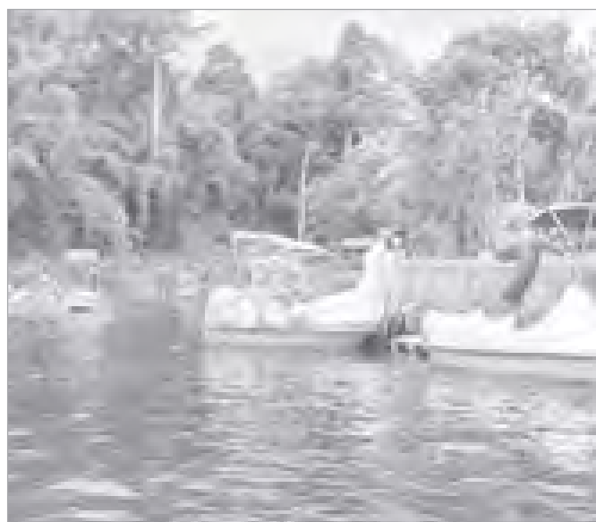
Water van de Berg Dam

Bagi mereka yang hobi memancing tersedia kolam-kolam pemancingan di sekitar hotel, dan bagi putra-putri Anda tersedia tempat rekreasi dan hiburan air, kolam bola, perahu karet, cy-