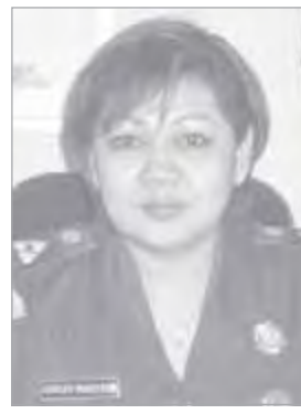
Shirley Manutede SH

KUPANG (TERBITOP) — Guru-guru Sekolah Menengah Atas (SMA) Negeri 1 Kota Kupang, Nusa Tenggara Timur (NTT), minta lembaga penegak hukum di daerah ini memberikan perlindungan hukum terhadap guru selama mereka menjalankan profesinya di sekolah.