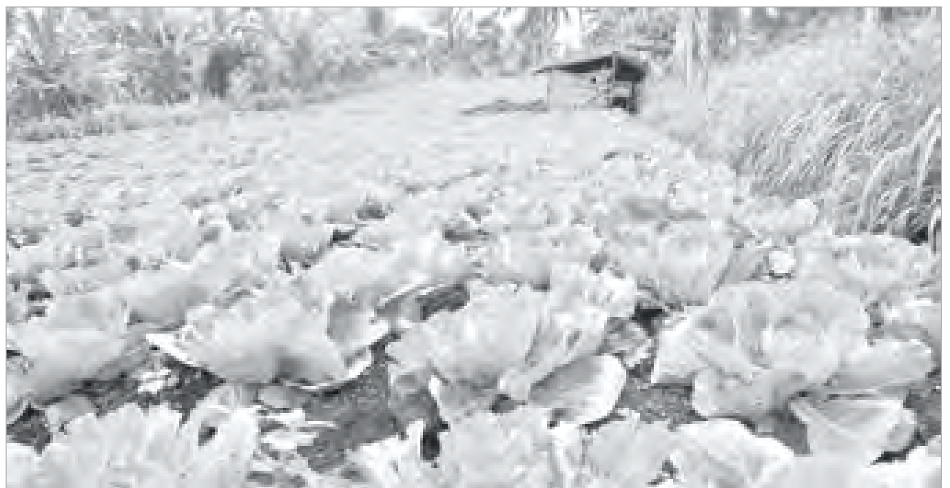
Sayuran menjadi komoditas andalan juga salah satu ikon Kota Gisting, termasuk kol yang tumbuh subur di kota tersebut.