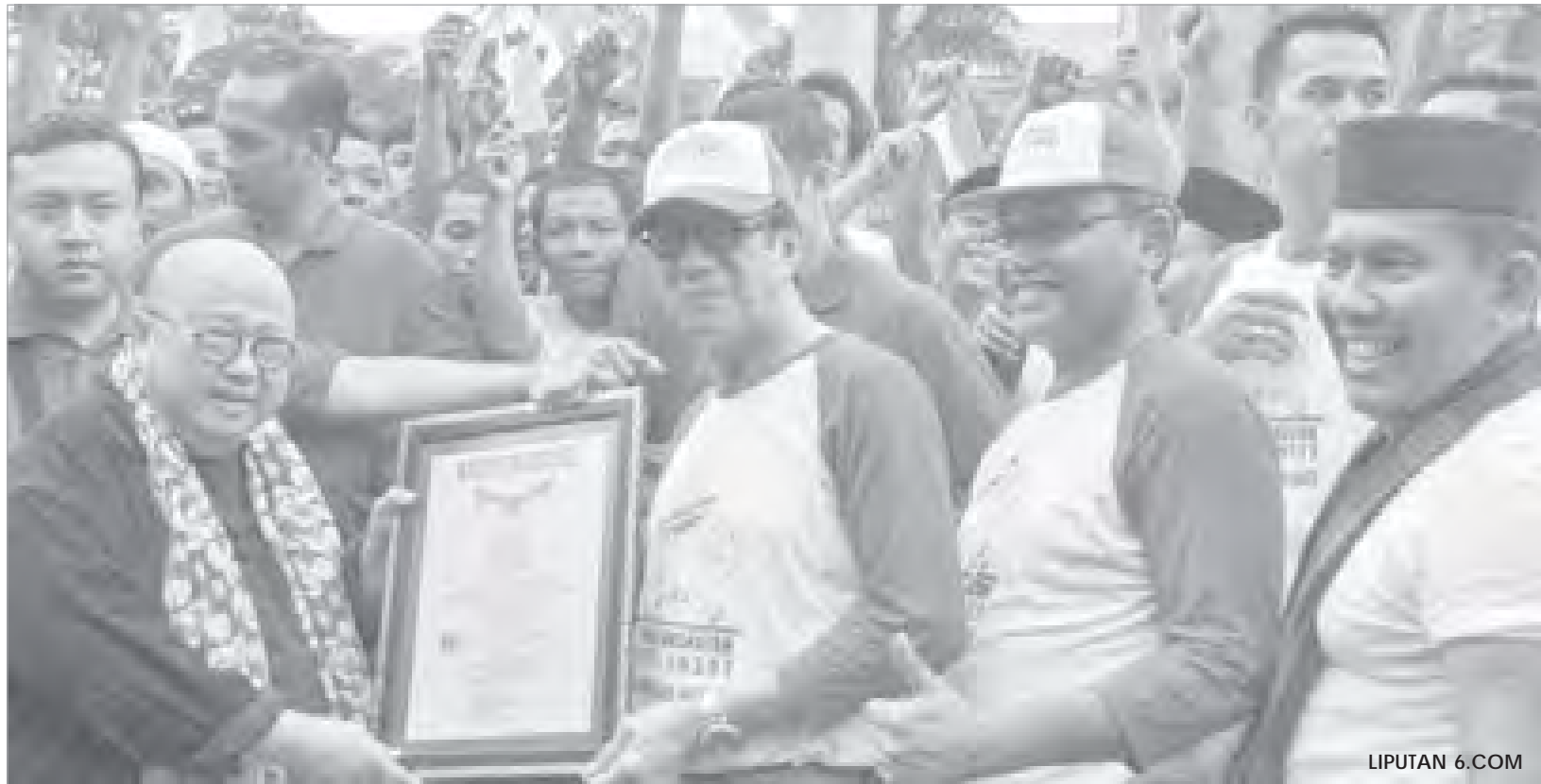
PECAHKAN REKOR MURI — Menkumham Yasonna Laoly ketika menerima penghargaan rekor Muri di LP Cipinang, Jakarta, Senin (15/8). Peringati HUT RI Ke-71, ribuan warga binaan lapas narkoba se-Indonesia pecahkan rekor MURI dengan bernyanyi serempak.