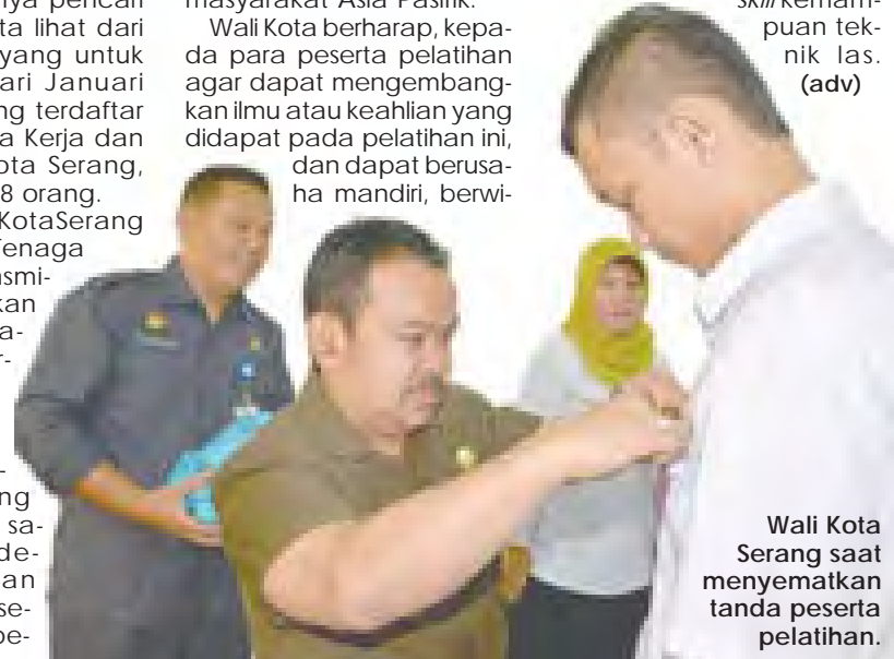
Wali Kota Serang saat menyematkan tanda peserta pelatihan.