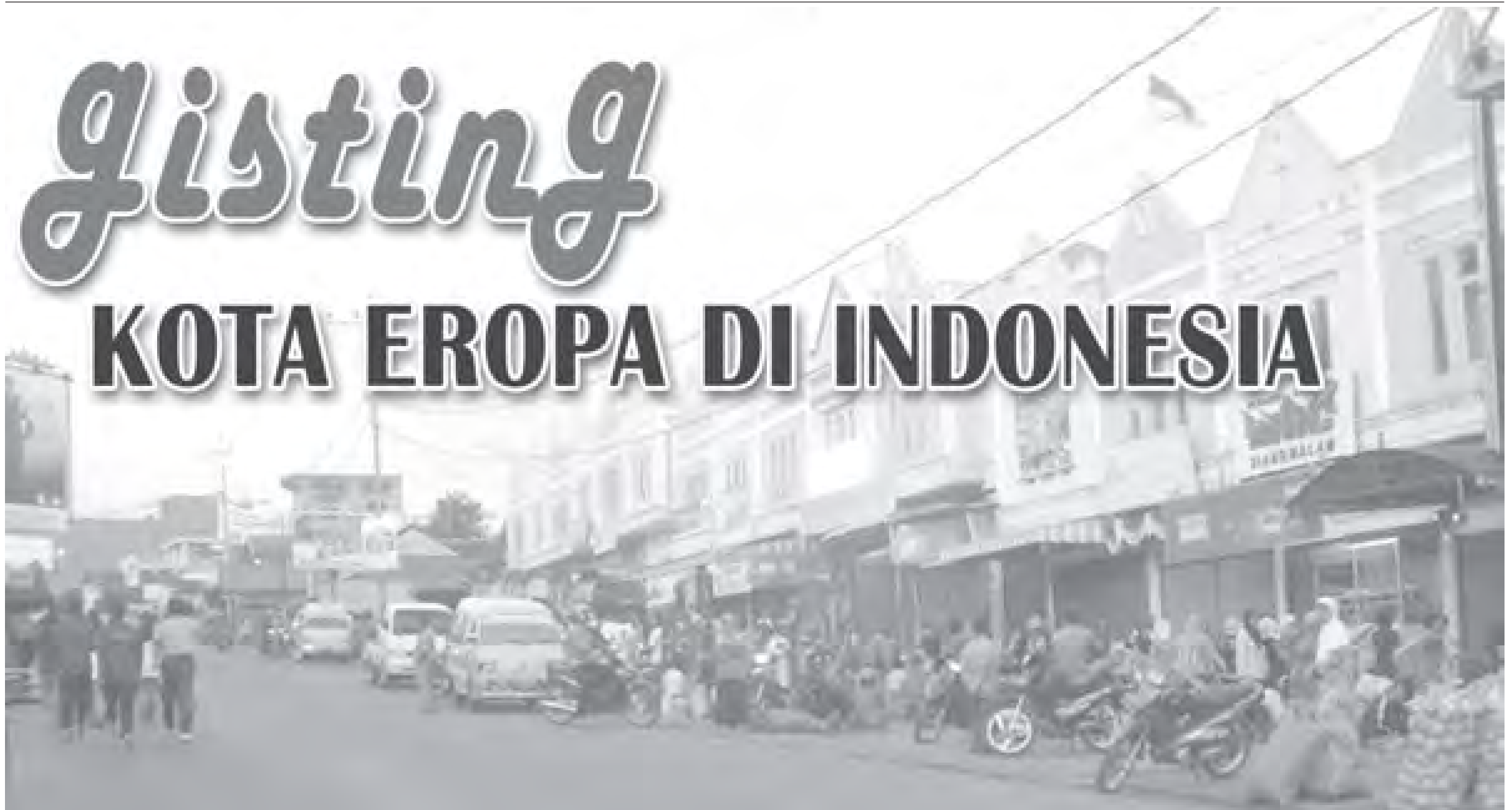
Gisting adalah daerah sentra utama sayur-sayuran baik didistribusikan di dalam kabupaten, maupun antarkabupaten, juga di pasok ke Pasar Induk Kramatjati Jakarta. Pasar sayuran Gisting merupakan pasar sayur terbesar di wilayah Provinsi Lampung. Nampak suasana pasar sayuran Gisting yang tertata rapi ramai banyak dikunjungi para pembeli.

W ISATA merupakan salah satu kebutuhan bagi masyarakat, saat ini sudah menjadi bagian dari kehidupan. Indonesia merupakan negara yang kaya dengan destinasi wisatanya. Tanggamus adalah salah satu tujuan destinasi wisatawan, baik wisatawan domestik maupun mancanegara. Gisting merupakan sebuah kota kecil yang berada 47 kilometer barat Kota Pringsewu dan masuk ke dalam wilayah administrasi Kabupaten Tanggamus, Provinsi Lampung.