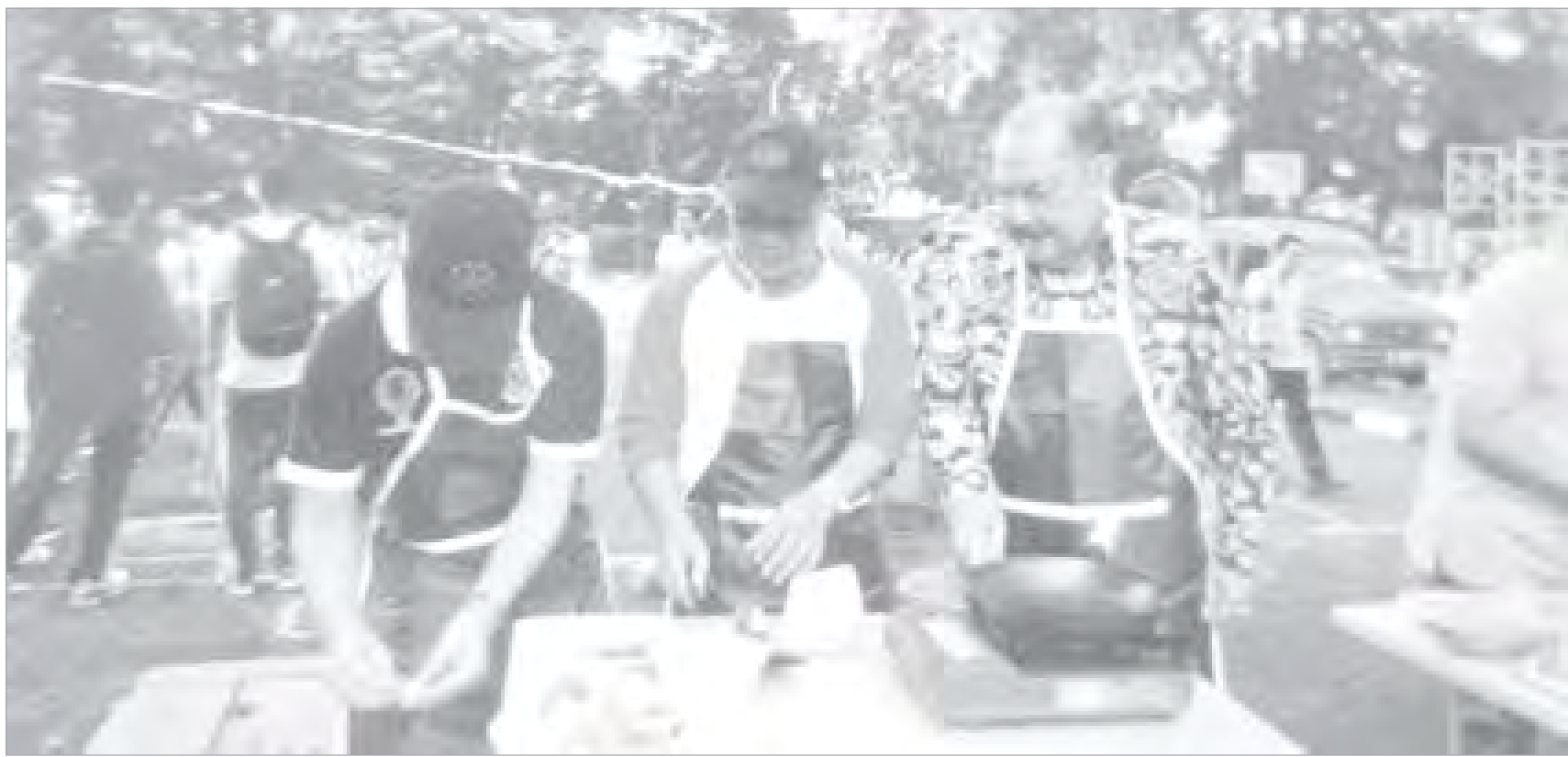
HUT KEMERDEKAAN RI KE-71