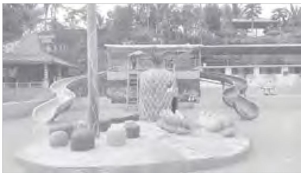
Kolam renang Butterfly yang akan memanjakan setiap pengunjung di Kota Gisting.