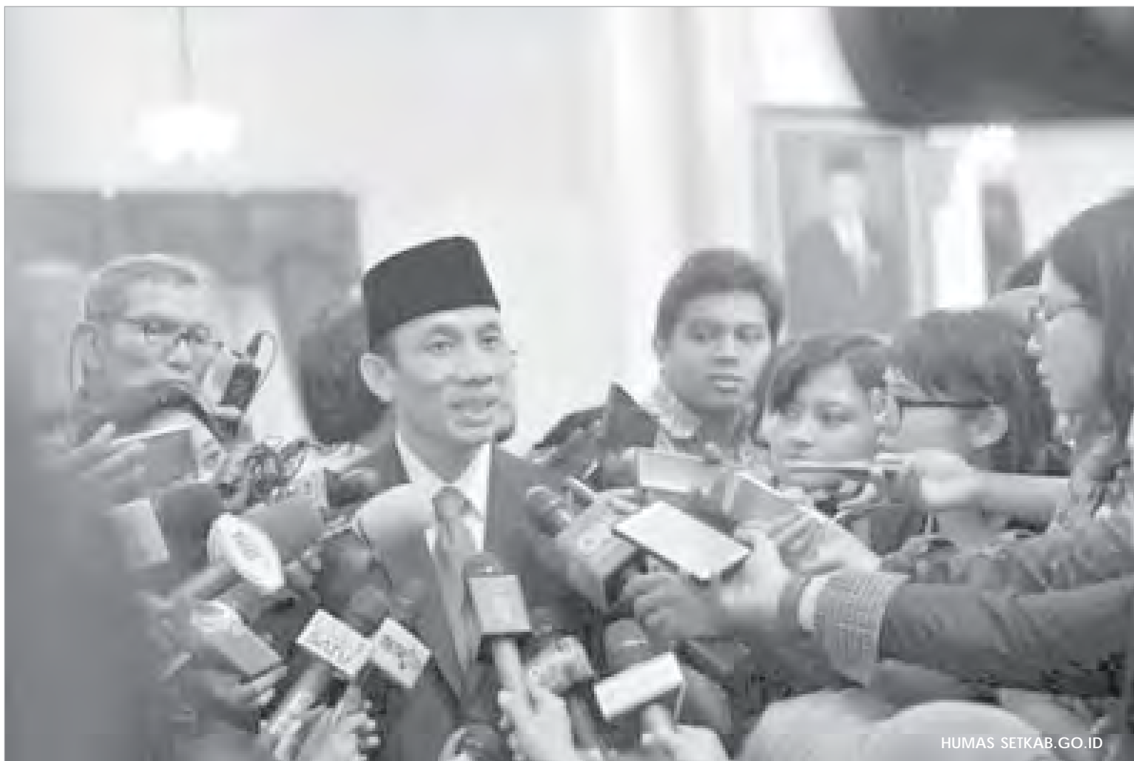
JAWAB WARTAWAN — Arcandra Tahar saat menjawab wartawan usai dirinya dilantik sebagai menteri Energi Sumber daya Manusia (ESDM) oleh Presiden Jokowi, di Istana Negara, Jakarta, Rabu (27/7) siang.

Meskipun mengakui bahwa Arcandra sempat memiliki paspor AS yang sudah dikembalikan sebelum ia diangkat menjadi menteri, Yasonna menegaskan bahwa Arcandra masuk ke Indonesia menggunakan paspor Indonesia yang masih aktif. "Kalau itu paspor (AS) saya bilang ada tetapi