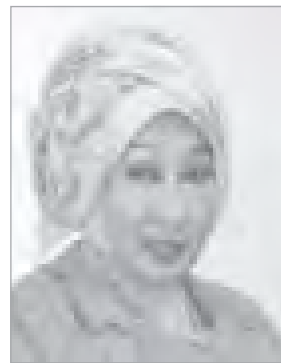
Hj Yemmelia SE, MSI

LEBAK (TERBITTOP) — Menjelang pemilihan gubernur dan wakil gubernur Banten, konstalasi politik di Tanah Jawa mulai menghangat. Hal itu terlihat setelah masing-masing para bakal calon mendapatkan pasangan untuk maju pada bursa Pilkada Banten tahun 2017 mendatang.