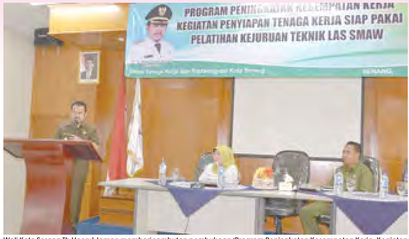
Wali Kota Serang Tb Haerul Jaman memberi sambutan pembukaan 'Program Peningkatan Kesempatan Kerja, Kegiatan Penyiapan Tenaga Kerja Siap Pakai dan Pelatihan Kejuruan Teknik Las SMAW' di BBLKI Kota Serang.

WALI KOTA Tb Haerul Jaman memotivasi peserta pelatihan teknis las di BBLKI Kota Serang, Senin (1/8) lalu. Wali Kota mengharapkan agar peserta yang mengikuti pelatihan teknik las ini mampu meningkatkan lapangan kerja dan mengurangi pengangguran di Provinsi Banten, khususnya di Kota Serang.